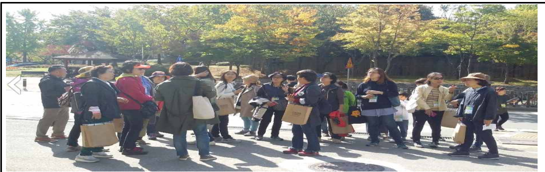
고아젤 마을 해설사 (고잔동 아름다운이야기를 제일 잘 해설하는 사람들)

세월호 참사 3주기 이웃들의 추모 꽃집 후원을 부탁드립니다. ▶ 일시 : 2017년 4월 16일(일) - ▶ 장소 : 단원고 앞 삼거리 ▶ 주최 : 고잔1동주민자치위원회 ▶ 후원기관 : 동원3동(0136-0146-01) 산부종합사회복지관 (다목적 영주초 앞길) ▶ 후원회 사무국 : 031)480-0075 / 010-3712-6274 2017년 4월 16일 봄 이웃이 416가족들에게 알립니다. "기억이 가자"