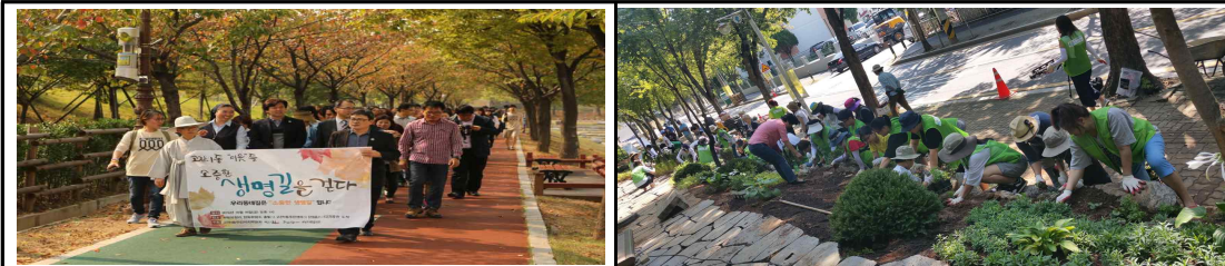
소중한 생명길 → 소생길 정원 (공동체 힐링공간 조성)