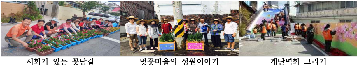
시화가 있는 꽃담길