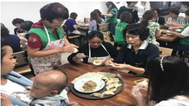
다문화가정 한국문화체험 프로그램