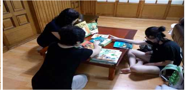
사랑의 도서기증 서[書]로가치나눔