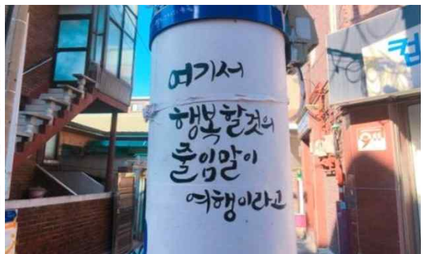
캘리그래피-우리말 행복길 조성