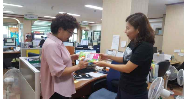
출산장려시책-아기 형견책 나눔