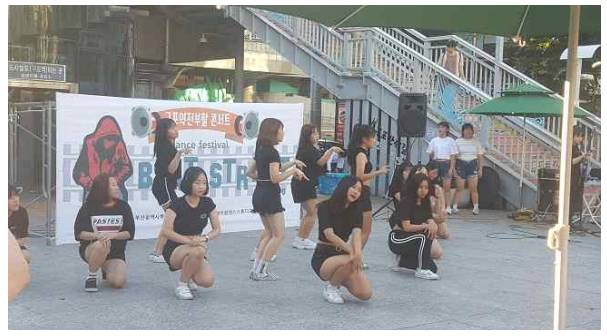
청소년 방과 후 예능교실