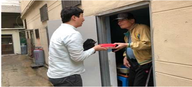
사랑의 밑반찬 배달