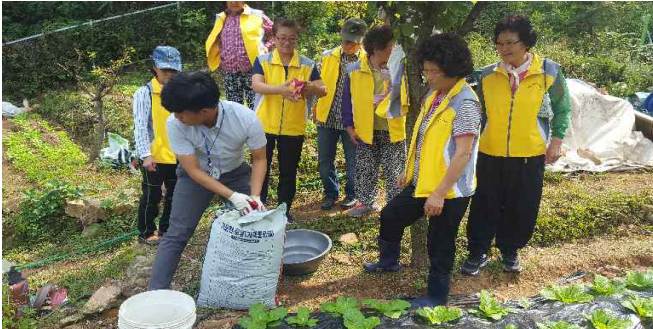
마을공동체 텃밭 가그린 농장 운영