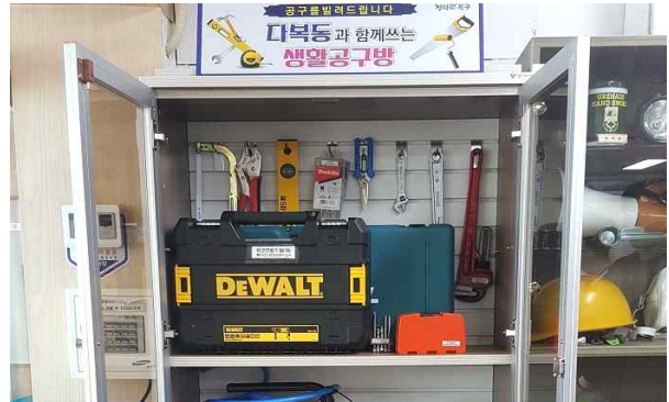
함께 쓰는 생활공구방 운영