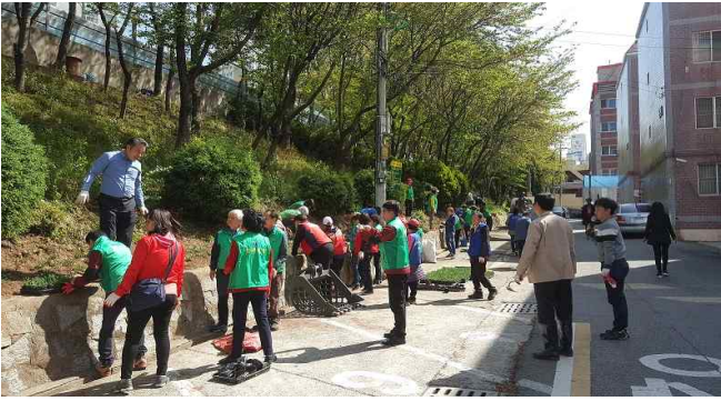
남해고속도로 법면 꽃동산 조성