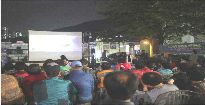
숙등 이웃사촌 작은 영화제