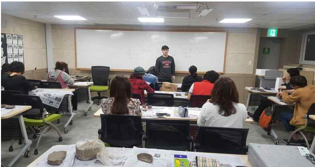
청년예술가와 함께하는 도예교실