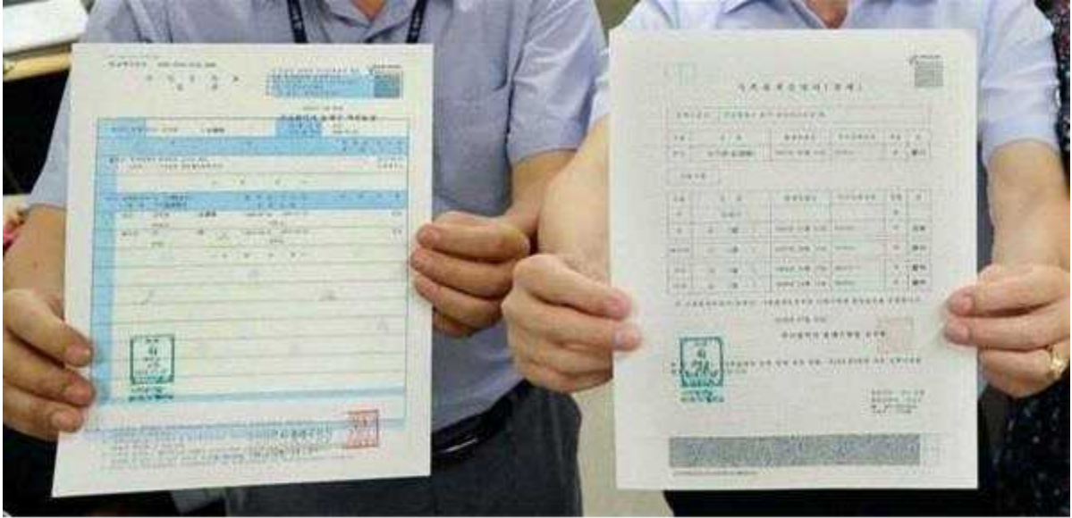
손끝으로 주민등록 등본을 읽을 수 있어요(점자로 변환된 민원서류)