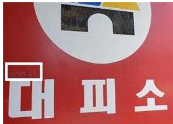
안전대피소 표지판 점자 스티커 부착