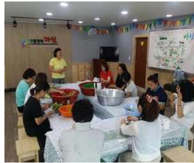
▲ 어르신께 배우는 전통음식