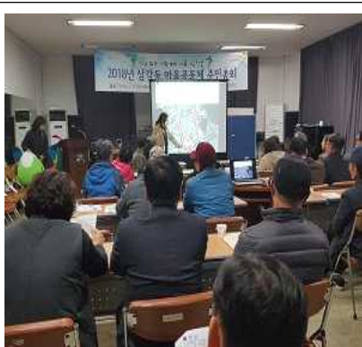
▲ 주민총회 의견수렴