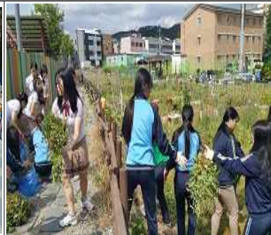
▲ 뜻깊은 봉사활동