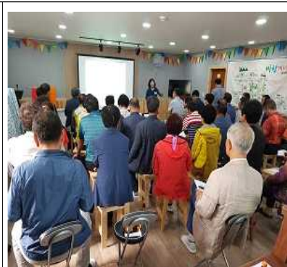
▲ 주민자치센터 공모 논의