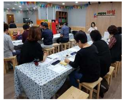
▲ 각종회의 장소 운영