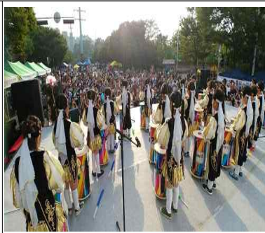
▲ 삼각 없는 거리 축제