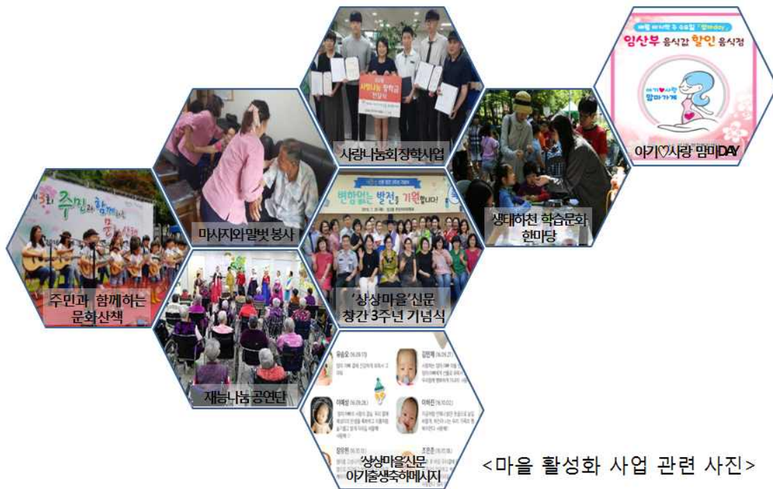
<마을 활성화 사업 관련 사진>