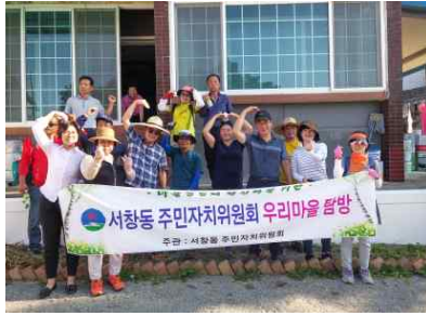
【우리마을돌러보기 「현장체험학습단」 운영】