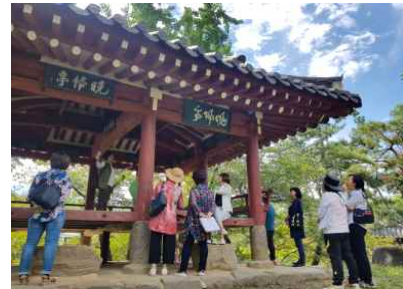
【서창주민 문화해설사 양성과정 「서창들따라, 마을을 노래하다」】