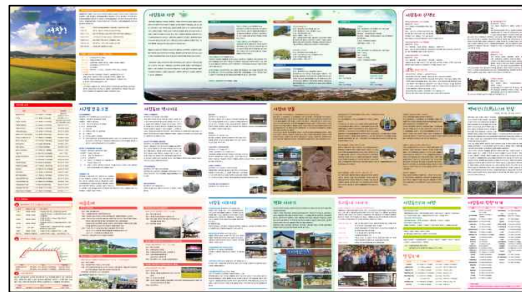
【「아껴둔 보물창고 서창! 마을에서 꿈을 꾸다」 마을지도 제작】