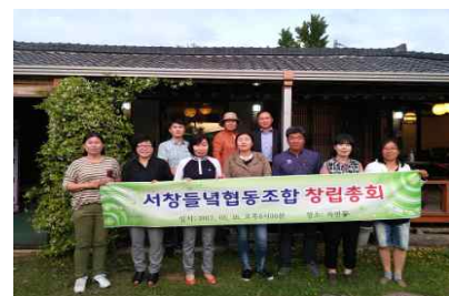
【서창들녘 협동조합-마을чат집 「마실」 및 로컬푸드, 마을밥상 운영】