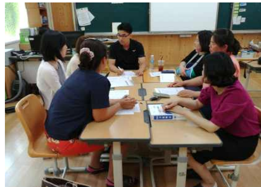
【마을교육공동체 네트워크 구축】