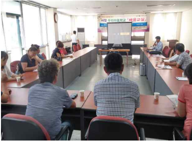
【서창우리마을학교 배움교실 운영】