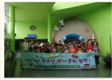
청소년 역사 문화탐방