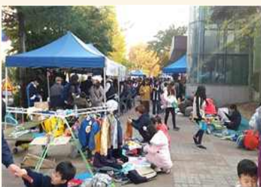
송학골 어깨동무 나눔장터