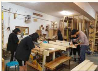
폐목재 활용 화분만들기