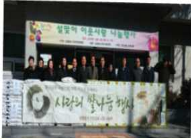
명절맞이 사랑의 쌀 나눔