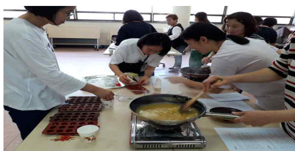
엄마 배움 모꼬지 『양갱 만들기』