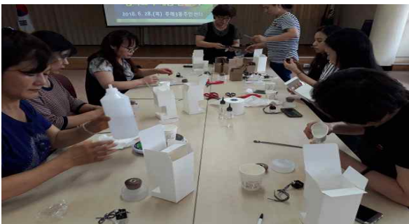
엄마 배움 모꼬지 『디퓨저 만들기』