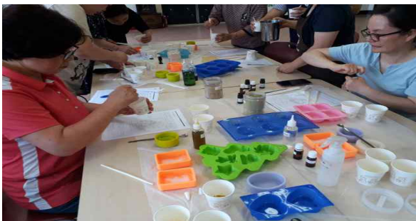
엄마 배움 모꼬지 『천연비누 만들기』