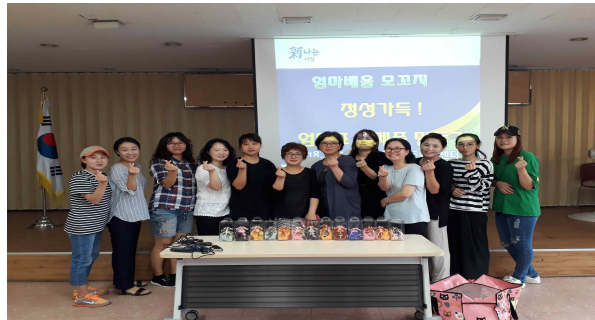
엄마 배움 모꼬지 『한복저고리 방향제 만들기』