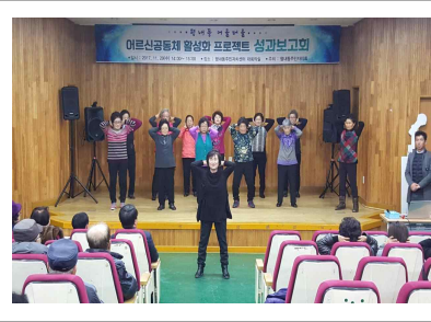
성과보고회 어르신 공연