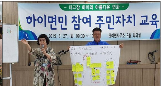
마을의제 발굴(조별 논의사항 발표)