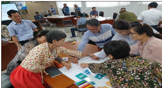
자발적 주민자치 실천의지 다짐 지장 날인