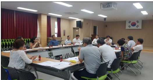
주민자치회 시범실시 확대 간담회