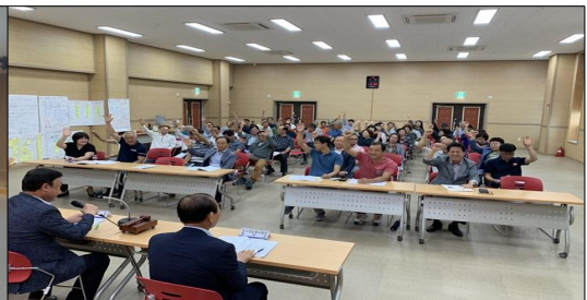
주민자치회 신청을 위한 주민총회