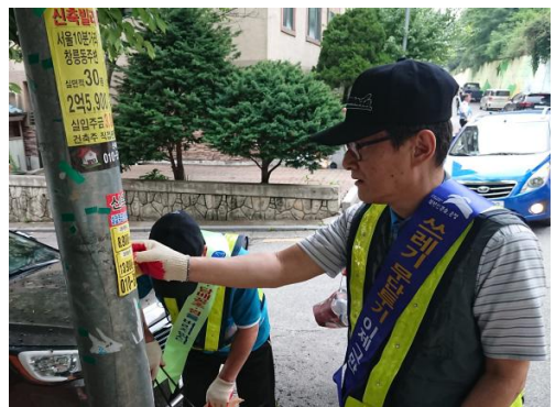
불법 부착물 제거작업