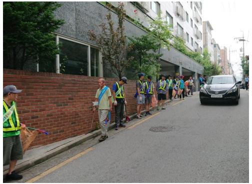
환경정화활동 이동 간 차량 안전 유도