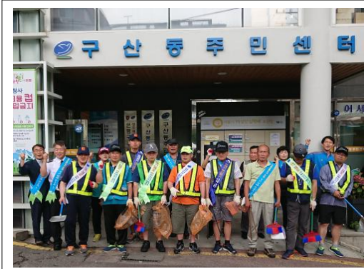
지역사회연계 환경정화활동 합동 사진