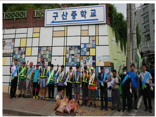
지역사회연계 환경정화활동 합동 사진