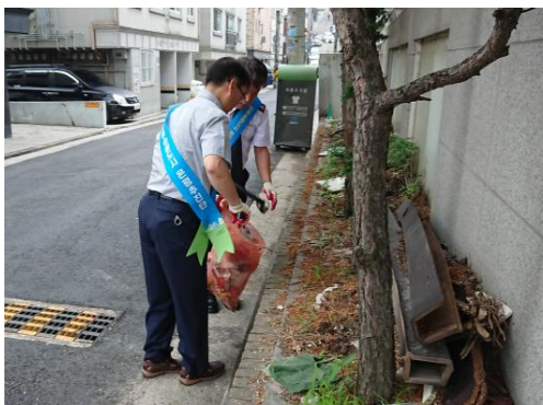
불법 투기물 환경정화모습