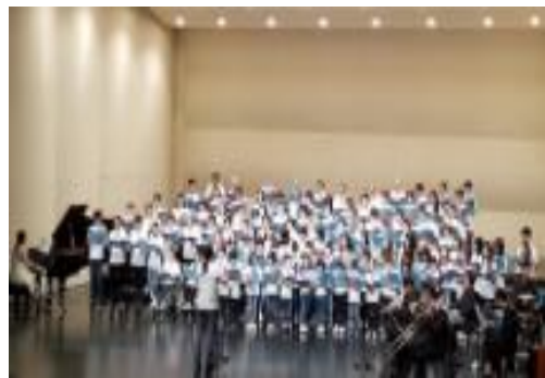
일등 100인패밀리 합창단 공연