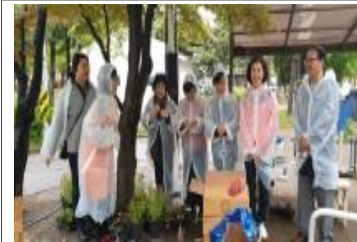
(마을일자리) 일등 마을정원사