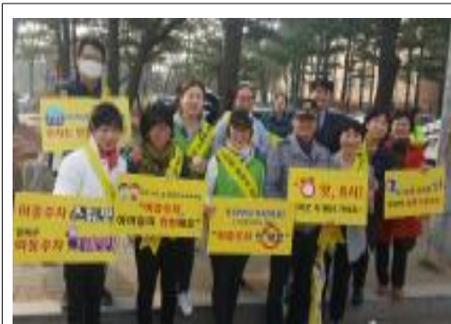
안전한 통학로만들기 노란풍선캠페인