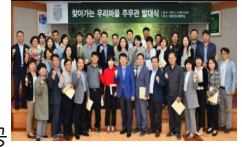
우리마을 주무관 발대식