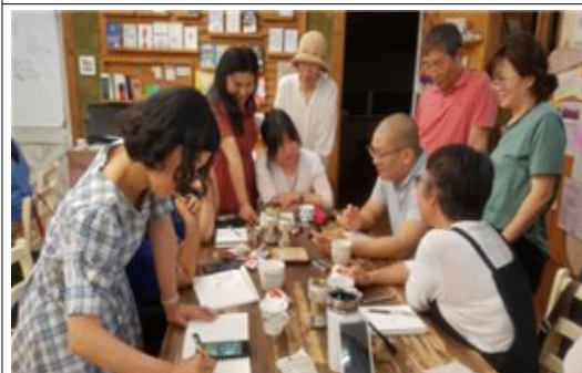
마을 아카이브 작업