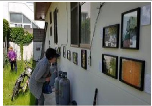
사진을 관람하는 주민들