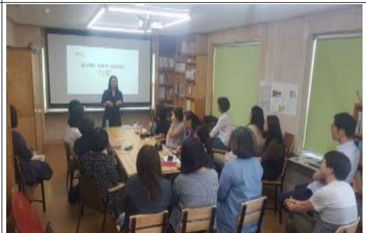
「일상의 기록」 주민강좌