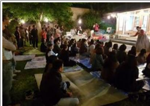
전시회 여는 마당을 지켜보는 사람들